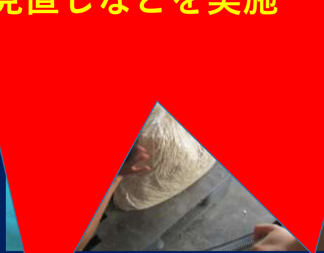
掃除機で吸引し密封する